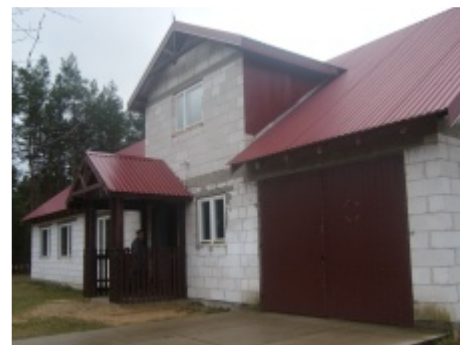
Frontowa elewacja remizy

Wielkim pragnieniem strażaków jest doprowadzenie budynku do takiego stanu, aby stał się on azylem dla młodzieży i miejscem spotkań wszystkich mieszkańców Bandyś. Strażakom marzy się sprzęt świetlicowy i komputery. W budynku odbywają się już zabawy wiejskie, dyskoteki oraz uroczystości rodzinne. Aby to wszystko zaczęło w pełni funkcjonować, potrzebne są jednak fundusze. W ubiegłym roku od Rady Gminy Straż w Bandysiach otrzymała 27 tysięcy złotych