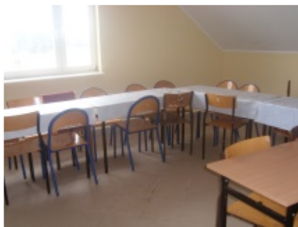
Sala spotkań na poddaszu