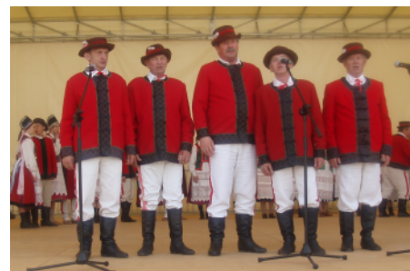
Kurpiowskie śpiewy mężczyzn.

wsi. Dla nich organizowane są konkursy. Nasza gmina brała udział w konkursie na „Najlepszy produkt tradycyjny”, który rozegrany był w dwóch etapach: powiatowym i wojewódzkim. Do finału zakwalifikowały się 3 produkty.