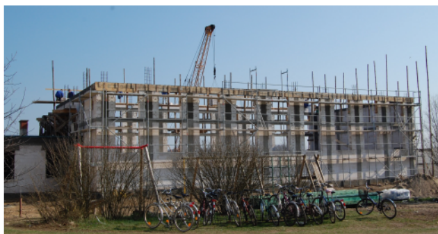
Budowa sali gimnastycznej w Surowem - kwiecień.

Obecnie budowa jest bardziej zaawansowana.